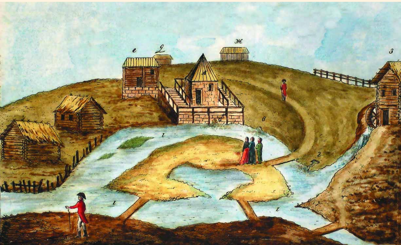
Вид Липецких минеральных источников. Рисунок И. Пфеллера. 1803 г.

шев, отдохавший на липецких водах, и одним из первых составивший описание липецка и курорта, восклицал: "Спешу преклонить колена в храме Рождества Христова, которому в основание сам Государь положил первой камень!" А вот как описывал сам храм человек, видевший величественные и