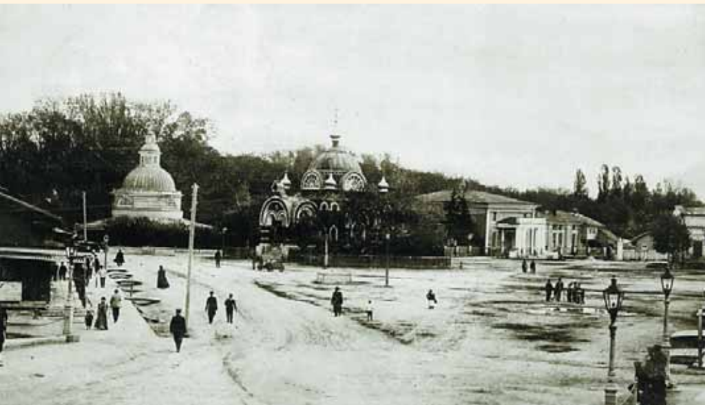
Старобазарная площадь Липецка. В центре – часовня святых Петра и Павла, построенная на месте Христорожественской церкви. Фото 1910-х гг.

рошо известная нам по фотографиям конца XIX – начала XX в.