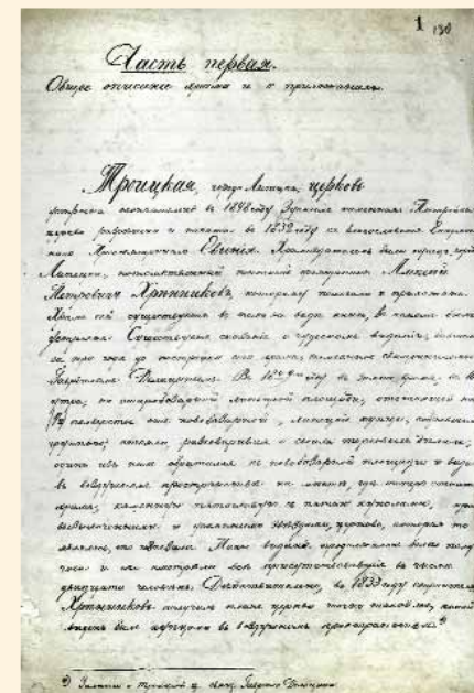
Летопись Троицкой церкви, в которой описывается чудесный случай видения церкви в 1829 г. Подлинник. ГАЛО

Началу строительства Троицкого храма предшествовал чудесный случай, известный в то время многим жителям города. Зимой 1829 г. в 10 часов утра липецкие купцы и мещане, находившиеся на Старобазарной площади (в полуверсте от Новобазарной, ныне — пл. Революции), в течение полчаса наблюдали необычайное явление. То появляясь, то исчезая, в небе ярко сиял позолоченными куполами, усыпанными звёздами каменный пятиглавый храм. И именно на том месте, где позже появилась Троицкая церковь. Свидетелями этого события были около 20 человек, которые, сняв шапки и