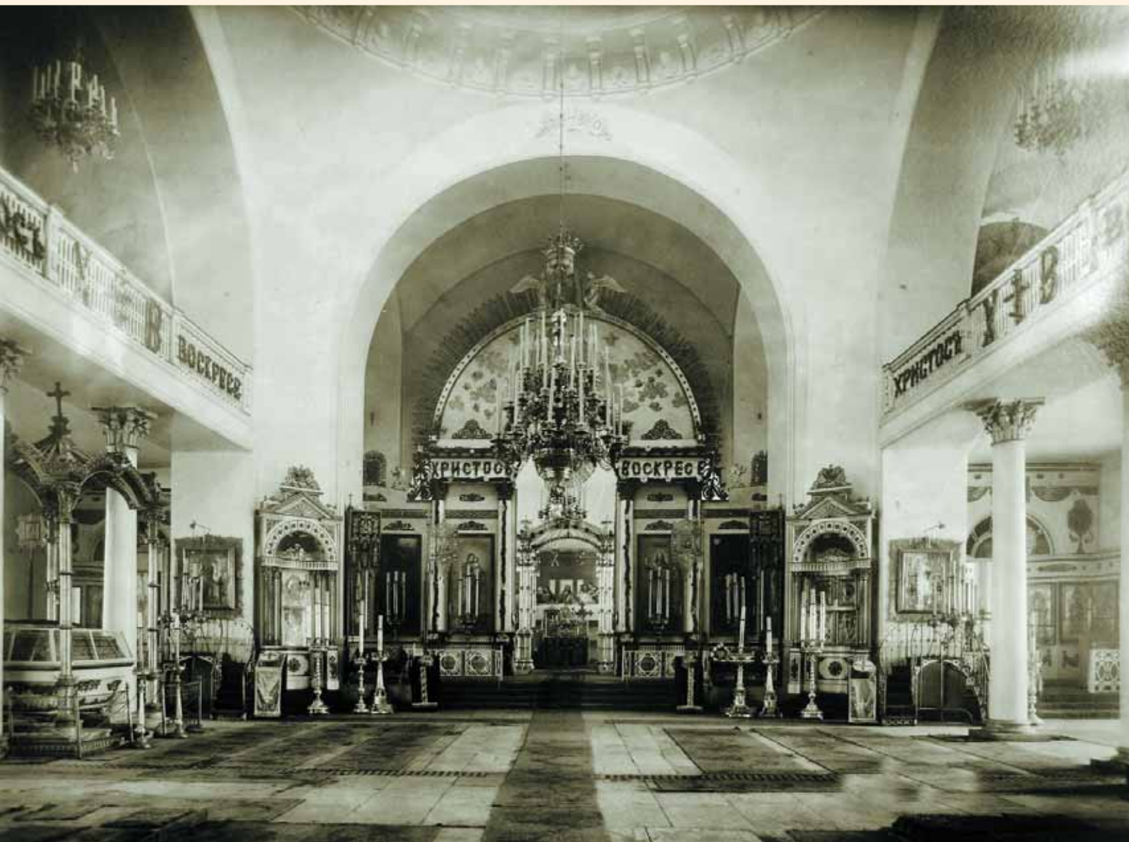
Внутренний вид Троицкого храма в праздник Воскресения Христова. Фото 1908 г. ЛОКМ

двусветного кубовидного объёма, увенчанного пятью главами. В плане храм представлял собой равноконечный крест. Примыкавшие с четырёх сторон к главному объёму здания прямоугольные в плане выступы, восточный, южный и северный, украшали четырёхколонные портики с фризом, украшенным триглифами и метопами и фронтонами с дентикулами, а западный — полуколонны с капителями ионического ордера. Стены храма были расчленены пилястрами, украшены треугольными сандриками и лепниной, увенчаны карнизами с дентикулами. Массивные главы имели строгий декор — окна и проёмы звонов обрамляли лишь карнизы и архивольты.