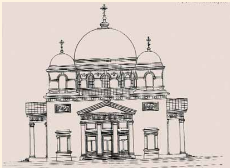
Фасад Троицкого храма. Рисунок И.П. Машкова. 1891 г. ЛОКМ