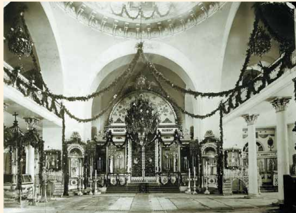
Внутренний вид Троицкого храма в дни престольного праздника Святой Троицы. Фото начала XX в.

В алтаре над главным престолом, отделанным кипарисом, была устроена стеклянная сень, поддерживаемая восемью витыми стеклянными колоннами и украшенная вызолоченной резьбой, висящими хрустальными призмочками. Напрестольная одежда была выполнена из бархата малинового цвета, с трёх сторон усеяна симметрично вышитыми золотом "отличной работы" херувимами, а на западной стороне изображён крест и два ангела на коленях, также шитые золотом, оцениваемые в 1 000 рублей серебром. Из до-