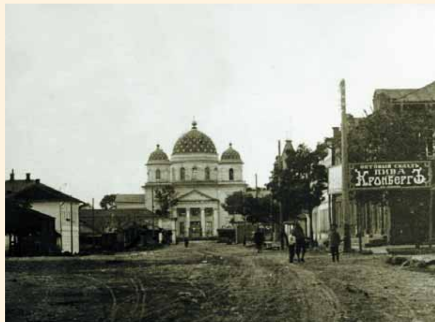
Вид на Троицкую церковь со стороны ул. Воронежской (ныне – Советская). Фото начала XX в.