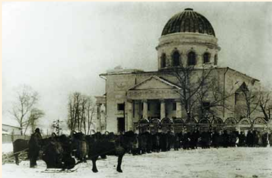
Троицкий храм после закрытия. Фото 1930–1931 гг.

пецкого РИК "предполагалось" использовать "под учреждение культуры". Однако на самом деле в бывшем Троицком храме "временно" разместился монтажный цех литейно-механического завода. Горсовет предложил заводу "немедленно приступить к снятию принадлежностей религиозного культа" и сосредоточить всё в алтаре. На следующий день Липецкое агентство Госбанка вывезло из храма 42 килограмма серебряной утвари, которая ещё сохранялась в храме после грабежа 20 марта 1922 г. В Государственном архиве Липецкой области хранится любопытный документ — акт об изъятии из Троицкой церкви двух икон, написанных на цинке: "...членом горсовета Колонтаевым и Неверовым взяты две иконы, писанные на цинке весом 41 кг, для неотложного ремонта машин электростанции". Церковное имущество же при этом было растащено. Представитель горсовета В. Колонтаев, со-