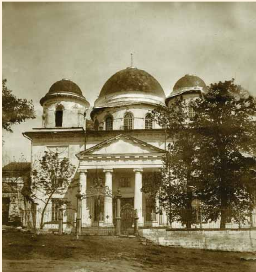
Южный фасад Троицкого храма. Фото 1930 г.

316 драгоценных камней, из них 56 бриллиантов, 33 осколка бриллиантов и золотой перстень. Всего на сумму 47 080 000 рублей 43 . Предварительно была составлена опись, из которой видно, насколько богат, в том числе и в художественном смысле, Троицкий храм. В описи много икон, украшенных серебряными ризами: образ Спасителя, св. митрополита Алексия, Марии Египет-