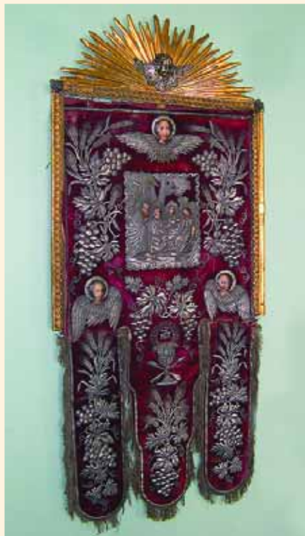
Хоругвь Троицкого храма. ЛОКМ

также были отделаны под мрамор. Пол, за исключением хоров, каменный.