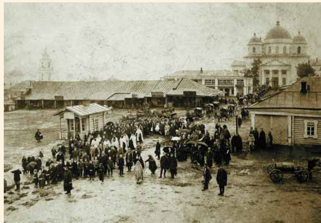
Похоронная процессия из Троицкой церкви на приходское Преображенское кладбище. Фото начала XX в.

В уважение великолетия Троицкого храма и особенно усердия прихожан, немало сделавших для его украшения, в последовавшей резолюции епископа Тамбовского на прошение липчан с 1851 г. разрешено было производить