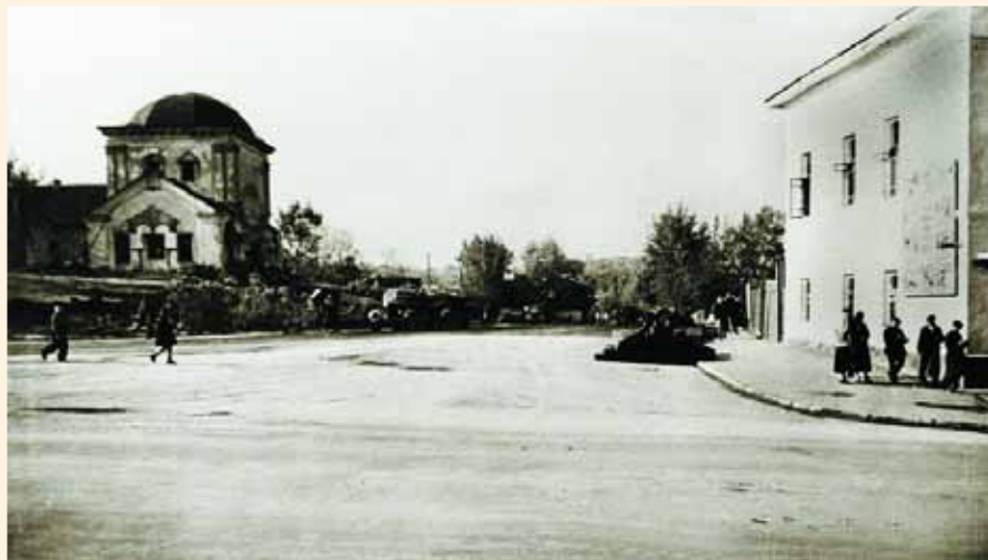
Вознесенская церковь. Фото второй половины 1950-х гг.