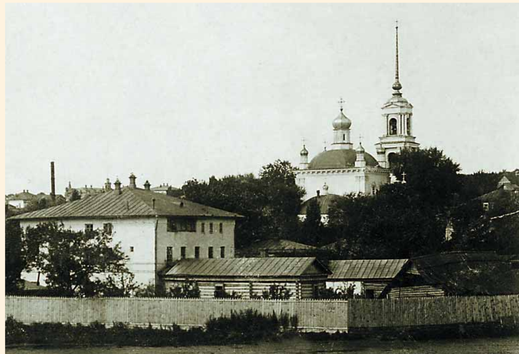
Вид на Вознесенскую церковь со стороны Верхнего пруда. Фото начала XX в.

Главной святыней бывшего Вознесенского собора являлась чтимая не только прихожанами, но и всеми жителями Липецка как явленная и чудотворная Казанская икона Божией Матери. Почитание этого образа липчанам было настолько велико, что указом Святейшего Синода разрешено было ходить с ним по всем приходам города.