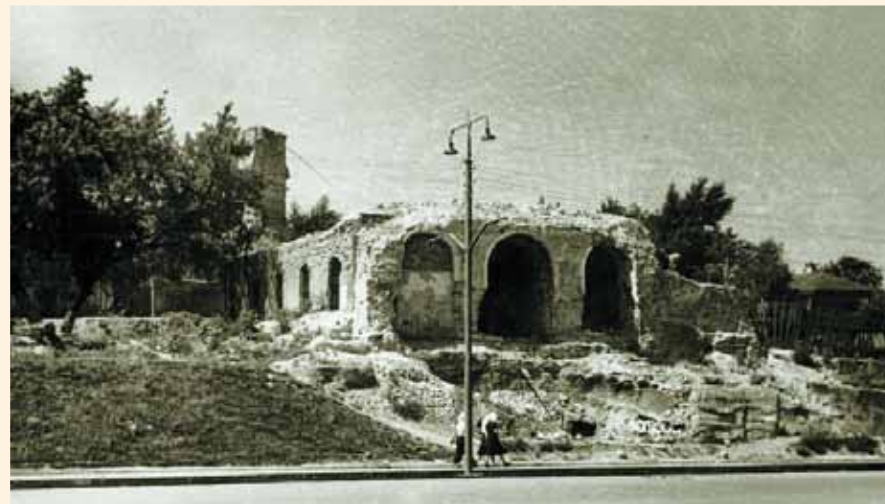
Разрушение Вознесенской церкви. Фото начала 1960-х гг.

Решение исполкома Липецкого горсовета от 25 сентября 1956 г. стало окончательным приговором Вознесенскому храму: "Здание бывшей Возне-