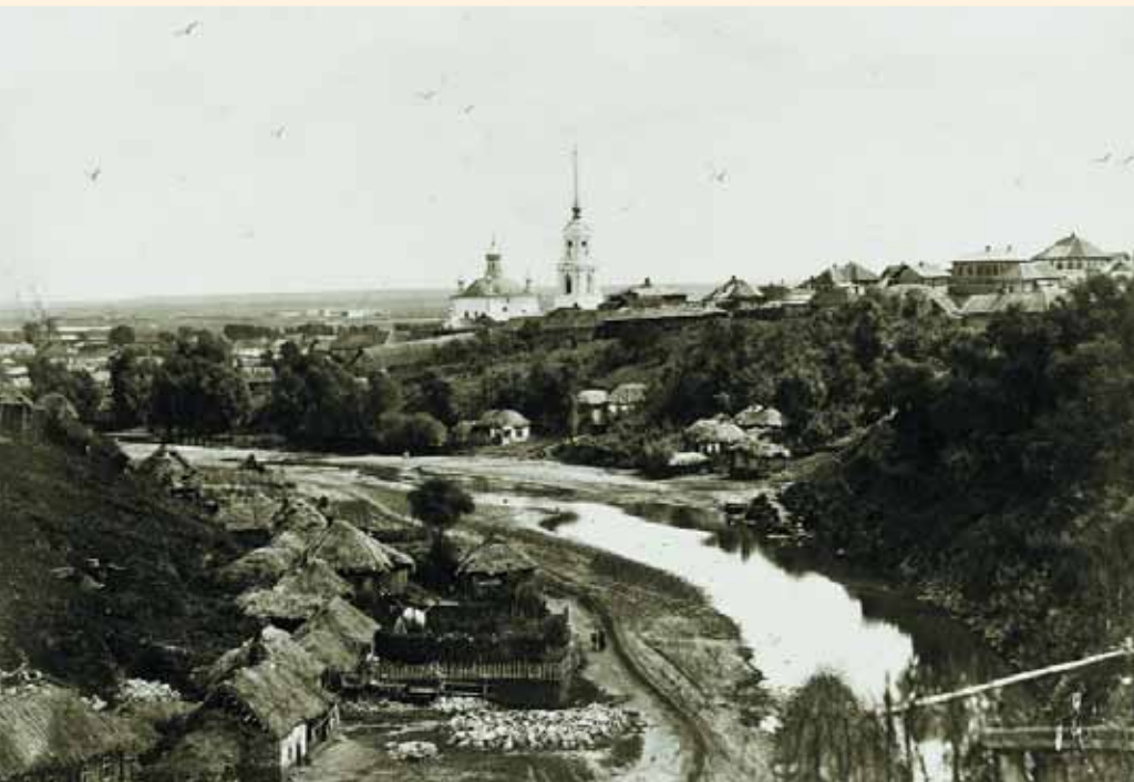
Вид на Вознесенскую церковь со стороны Городища. Фото 1870-х гг.

иконостасов — "иконной живописи, конца прошлого или начала нынешнего столетия (XVIII—XIX в. — Прим. авт.)" 15 .