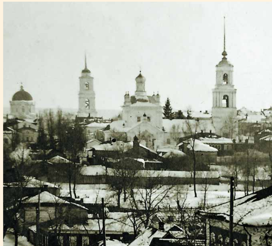
Вид на центральную часть Липецка с ул. Скатной. На переднем плане – Вознесенская церковь. Фото конца 1920-х гг.