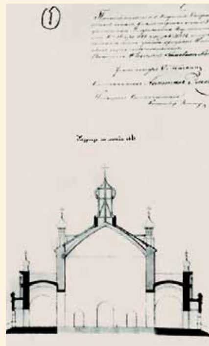
Разрез храма. 1844 г.