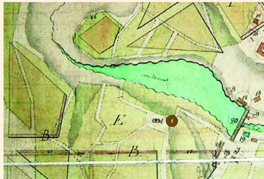
Фрагмент плана г. Липецка 1805 г. Под № 1 – Вознесенская церковь.

В Петербурге — в Синоде и Министерстве внутренних дел — проект на перестройку Вознесенского храма рассматривался в течение 1844—1846 гг. Департамент путей сообщения потребовал представления дополнительных чертежей, так как на проекте не были показаны существующие стены. Переписка о представлении чертежей длилась долго, так как уездный землемер уклонялся от их исполнения, боясь ответственности, а больше их выполнить было некому. Но, наконец, проект был доведен до соответствия, и 29 января 1846 г. Управление путями сообщения и публичных зданий Департамента искусственных дел МВД получило сообщение обер-прокурора Синода графа Н.А. Протасова: "Государь Император по Всеподданнейшему докладу моему Высочайше 24 января сего года соизволил утвердить проект на распространение существующей в г. Липецке Там-