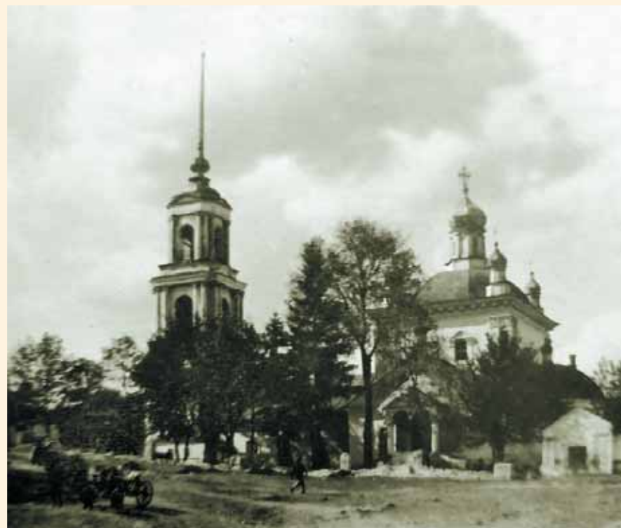
Вознесенская церковь после закрытия. Фото 1932 г.

рождественского собора и Вознесенской церкви. В итоге было принято постановление о закрытии этих храмов и возбуждении ходатайства перед облисполкомом ЦЧО об утверждении решений пленума Липецкого горсовета 36 . Постановлением секретариата исполкома ЦЧО от 2 сентября 1931 г. Вознесенская церковь была закрыта. Часть храма передали под центральную библиотеку, а большую часть — “Осавиахиму” под оборонную работу 37 . 10 марта 1932 г. президиум ВЦИК Советов утвердил постановление президиума облисполкома ЦЧО о ликвидации Христорождественского собора и Вознесенской церкви 38 .