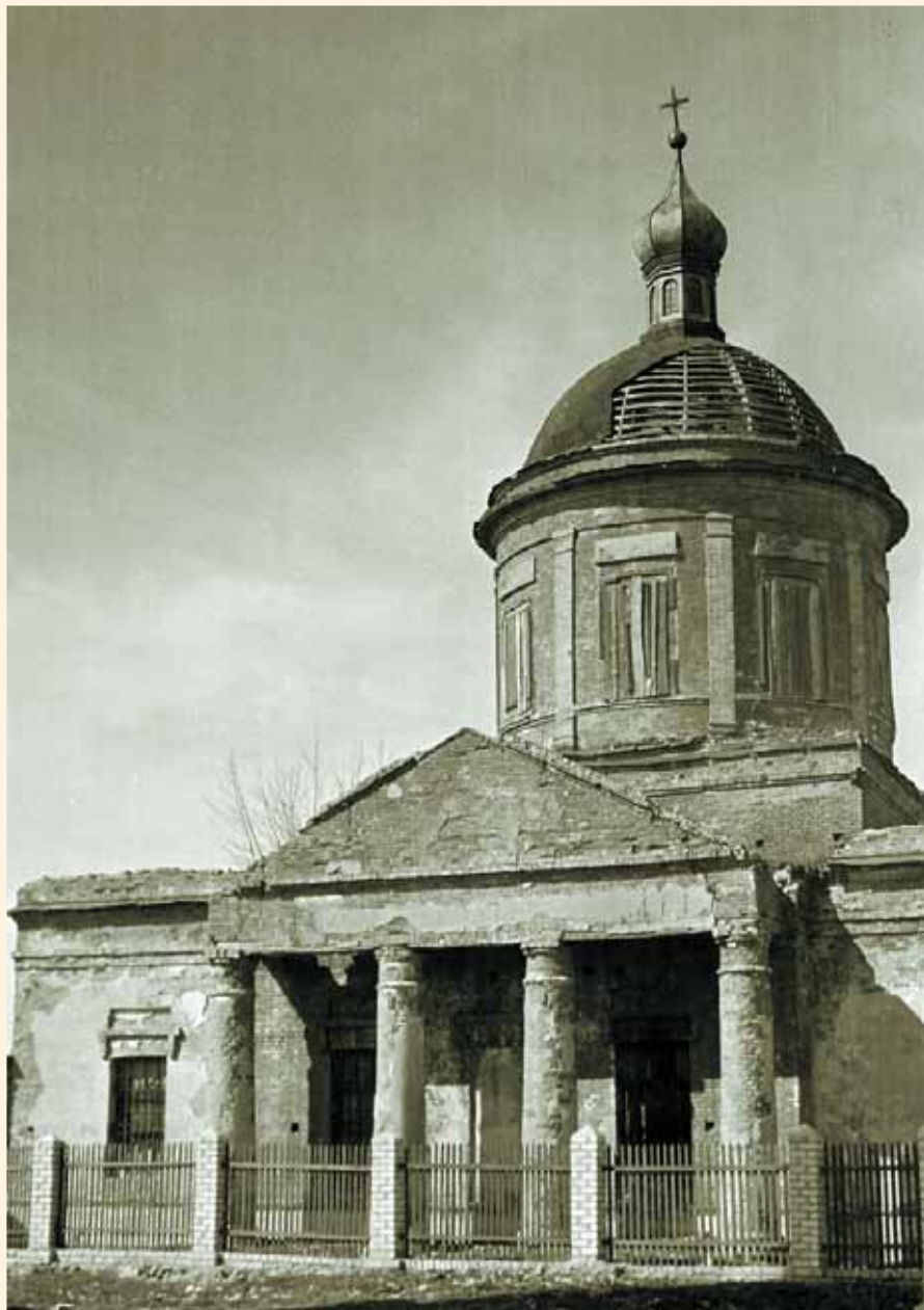
Успенская церковь. Фото 1960-х гг.

кадило и также серебряное облачение на престол.