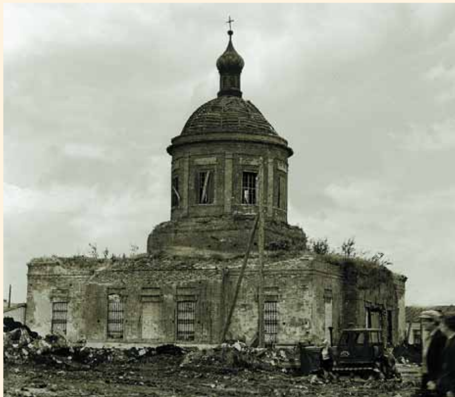
Успенская церковь перед разрушением. Фото начала 1970-х гг.

ла снесена колокольня Успенской церкви. Такая же судьба ждала со временем и сам храм.