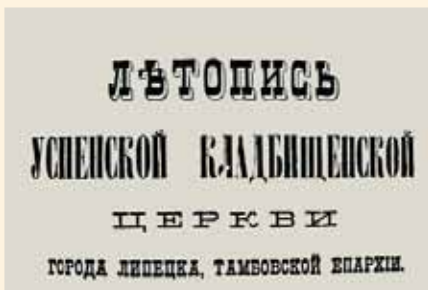
Титульный лист летописи Успенского храма. Подлинник.