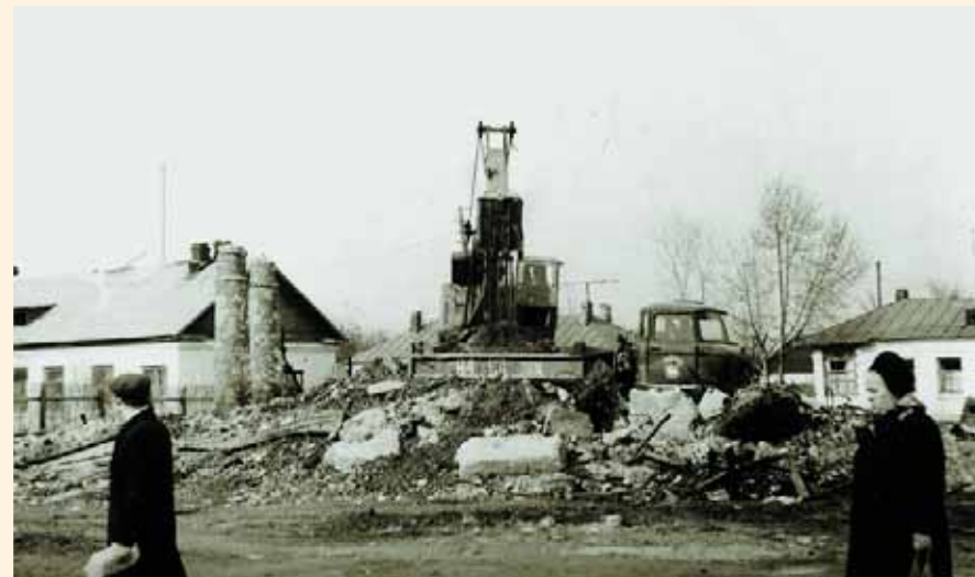
Разрушение Успенского храма. Фото 1973 г.