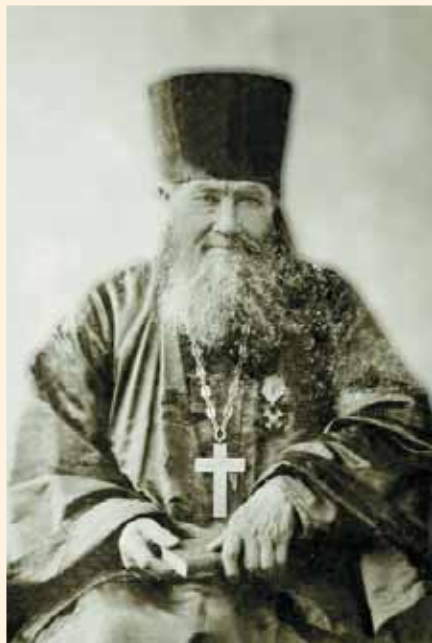
Протоиерей Иоанн Михайлович Рождественский (предположительно). Фото 1890-х гг.

стройки по смете, составленной архитектором Андреевым, определялась в 12 520 рублей 90 коп. При постройке здания должен был быть снесён старый деревянный дом — квартиры смотрителя и его помощника.