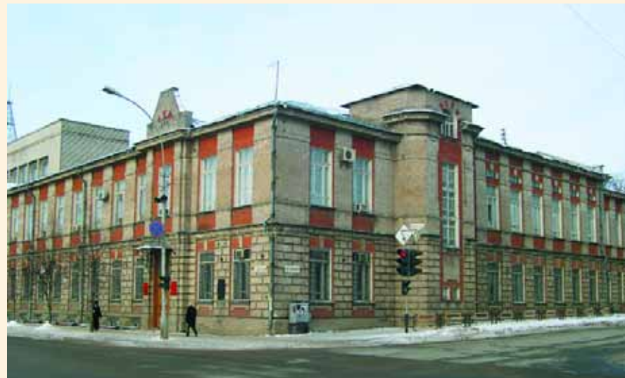
Современный вид здания бывшего духовного училища. Фото 2003 г.

бы, чтобы <...> училище носило название имени святителя Питирима, что может служить, с одной стороны, памятью того, что наше училище было освящено в год прославления святого Питирима, а с другой — залогом будущего процветания <...> училища под молитвенным покровительством новопреславленного святителя Питирима". Заслушав заявление смотрителя, "съезд находит его вполне отвечающим тому великому религиозному чувству, которое одушевляет всех членов съезда при мысли о прославлении Тамбовского Святителя" и обращается <...> к его Высокопреосвященству с просьбой ходатайствовать пред Святейшим Сино-