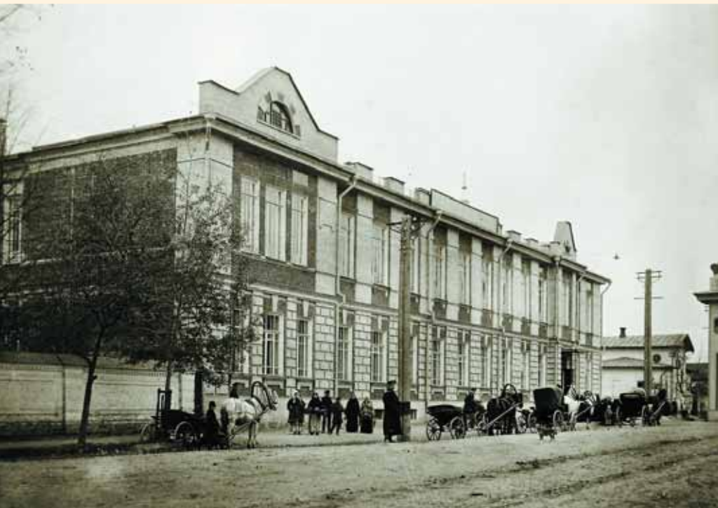
Здание Липецкого духовного училища со стороны Лебедянской улицы. Фото 1915 г. ТОКМ

В 1830 г. в училище преподавали следующие предметы: чистописание, грамматику российскую, грамматику славянскую, арифметику, пространственный катехизис, священную историю, географию, латинский, греческий язык, церковный устав и нотное пение. В XX в. к этим предметам добавились краткая русская история церковная и гражданская, природоведение и черчение.