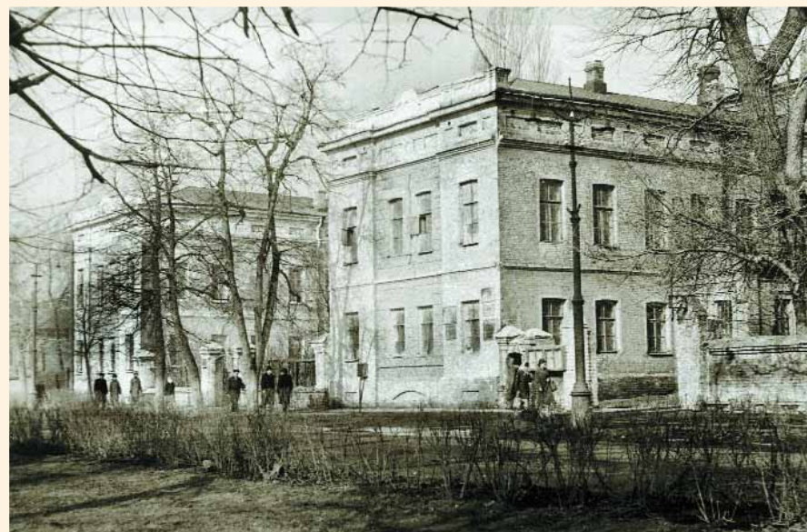
Здания общежития духовного училища на улице Дворянской (Ленина). Фото 1960-х гг.

Утром 15 января после благовеста в соборе состоялось само освящение храма. Первоначально среди храма было совершено освящение воды, после чего священнослужители в алтаре собирали престол, омывали и окропляли его святой водой, облачали в священные одежды. По облачении престола и жертвенника не только храм, но и все комнаты училищного дома были окроплены святой водой. После чего состоялся крестный ход по храму, закончившийся в алтаре возложением на