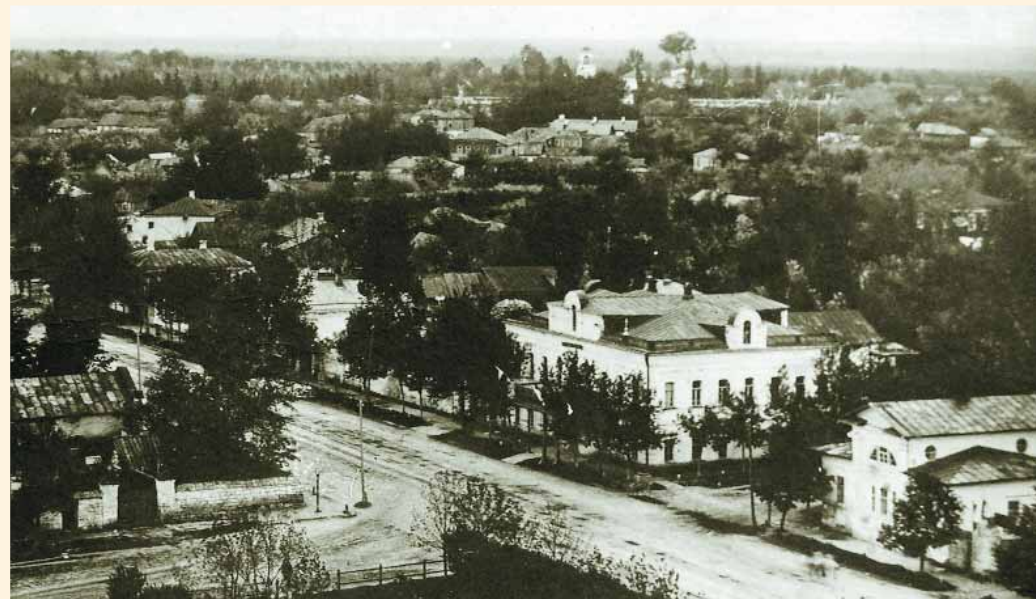
Вид с соборной колокольни на Лебедянскую улицу. В центре — двухэтажное здание духовного училища, пожертвованное в 1876 г. Трубецкими. Фото начала XX в.

Священник Иоанн Михайлович Рождественский прослужил в Софийской церкви до самой своей смерти, последовавшей 6 января 1898 г. За время своего служения в священном сане о. Иоанн был награжден скуфьей