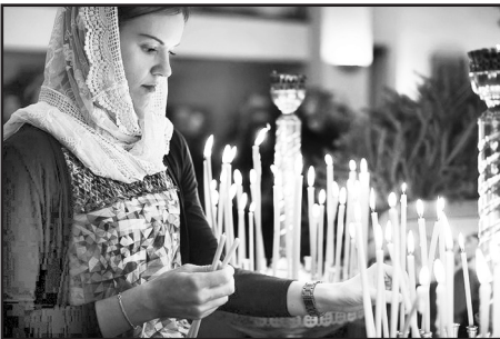
Молитва перед свечами.

Скупость. Леснь. Человекоугодие. Хвастовство. Не желание уступить и помочь ближнему.